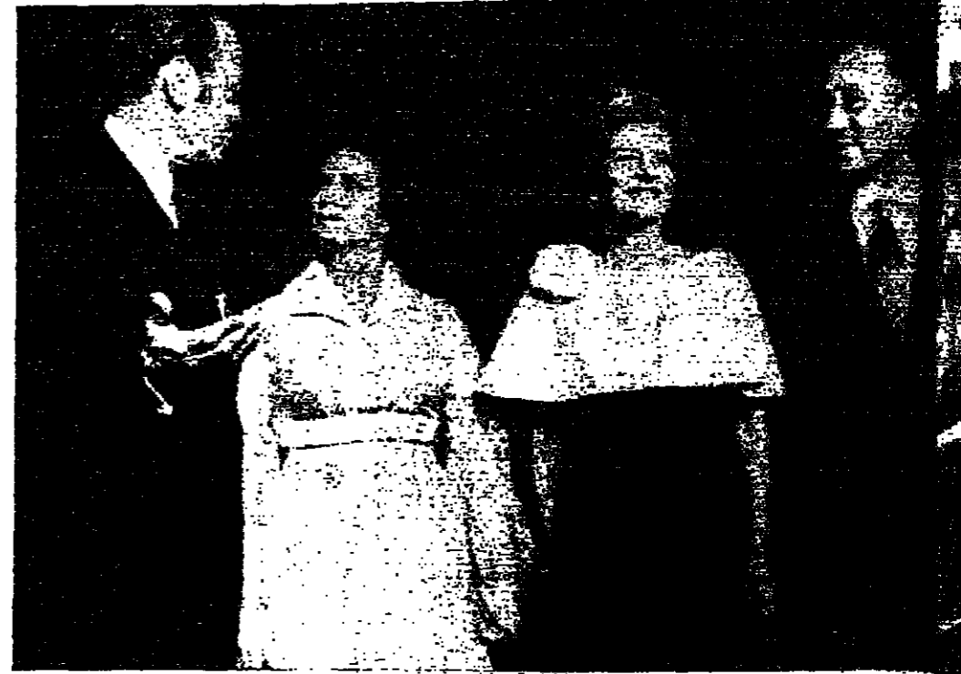
الرئيس السادات ، في قاعة العمة فيان ، والرئيس فوردي ، ايام البيت الابيض

تحدثت ابياء وصلت الحمينة براكشي ان الاعلام الغربية اخلت ترفوف الان الصعراء الفاضلة للاختلال السلسي ، وذلك بعد اقتناع مواطني الصعراء بان تحريرهم بات قريبا .